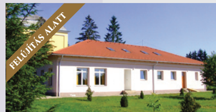
Óri István Ifjúsági Ház táborhely