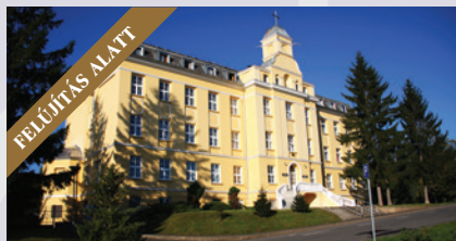
Szent Imre Missziósház