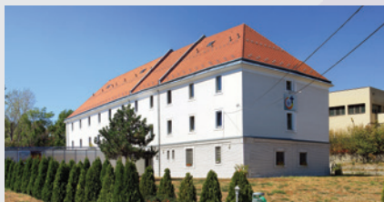
Szent Arnold Lelkigyakorlatos Ház