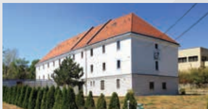
Szent Arnold Lelkigyakorlatos Ház