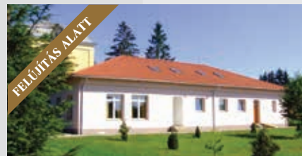
Óri István Ifjúsági Ház táborhely