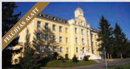
Szent Imre Missziósház